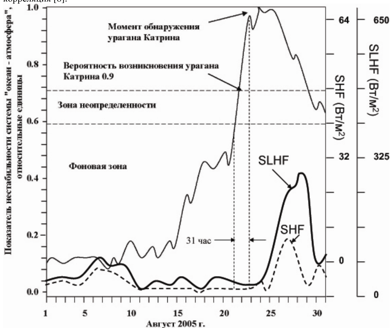
Рис. 3. Сравнительный анализ индикатора неустойчивости и тепловых потоков в динамике СОА в августе 2005 г. Обозначения: SHF (surface heat flux)- поверхностный поток физической (ощутимой) теплоты, SLHF (surface latent heat flux) - поверхностный поток скрытой теплоты.

показателями теплообмена в СОА перед зарождением урагана Катрина существует корреляция [8].